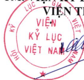
Dương Duy Lâm Viên