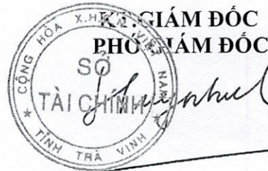
Huỳnh Bích Như